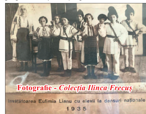
Fotografie - Colecția Ilinca Frecus

Meșterele și iscusitele femei novăcene, talentate în arta cusutului, țesutului, lucrării cămăși ori alte obiecte tradiționale ale gospodăriei țărănești pentru familiile lor,