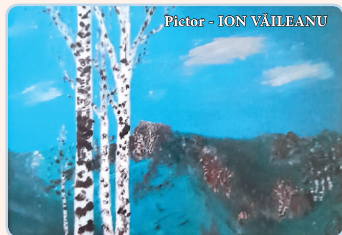
Pictor - ION VĂILEANU

Adie vântul și moșneagul își pune drept căpătâi sub cap mâneca cojocului și adoarme legănat de îngerii pădurii și zbenugiala șipotelor de argint. Un buștean de carpen putred în care și-a făcut loc o iască scăpărată de un amnar, luminează bezna ca o medalie fermecată prinsă de glezna pădurii.