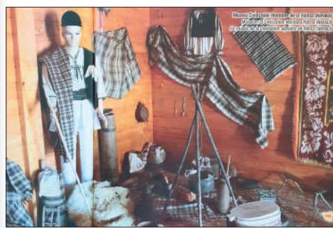
În dreapta sus, pe perete, covor din colecția personală, cu Tricolorul pe margini, cu o vechime de peste 100 de ani.

Costumul popular autentic reprezintă o marcă a identității etnice, cu valoare istorică și artistică, cu piese de vestimentație care și-au păstrat structura și croiala până în zilele noastre. Asemenea costume se constituie în adevărate documente etnografice. Să ne oprim puțin la unele tablouri de referință ale marilor noștri pictori, Theodor Aman, Nicolae Grigorescu, Gheorghe Tattarescu, care au pictat omul din popor în strălucitul costum popular. Regina Maria a României, oferă un exemplu de admirație față de costumul popular românesc, îmbrăcându-l, ca ținută oficială la toate marile evenimente naționale și internaționale.